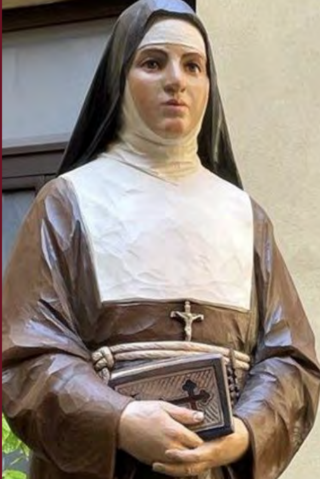
Santa María Francisca Rubatto Italia 1844- 1904

Nacida como Ana María Rubatto, en Carmagnola (Italia), el 14 de febrero de 1844, aunque no nativa, es considerada como la primera santa de Uruguay. Fue la fundadora en 1885 de la Congregación de las Hermanas Capuchinas, dedicada al cuidado de los enfermos y, sobre todo, de los niños y jóvenes abandonados.